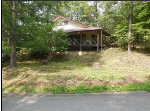
★森の中のスローライフ★