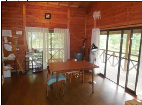
★家具・家電そのまま使用or処分可★