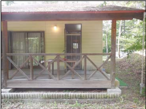
★ゆっくりと流れる時間★